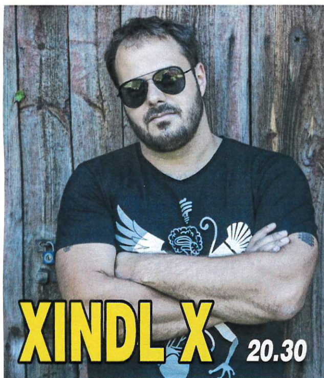
XINDL X 20.30